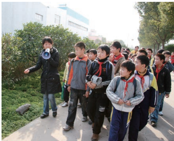
◀ 学生们参加内容丰富的社会实践活动

因为看到了村内资源在科普方面的巨大价值，以及周边地区在青少年科技教育方面的巨大需求，滕头村在1998年11月成立了滕头学生社会实践基地（下文简称“滕头基地”）。多年来，滕头基地充分挖掘滕头村和周边地区的科普资源优势，利用科普展馆、高科技农业示范园、拓展野营基地等设施，根据不同年龄阶段青少年学生认知能力和兴趣爱好设计活动。其中，与环境保护和现代农业有关的科普活动，是滕头基地在传播科学方面最大的亮点。