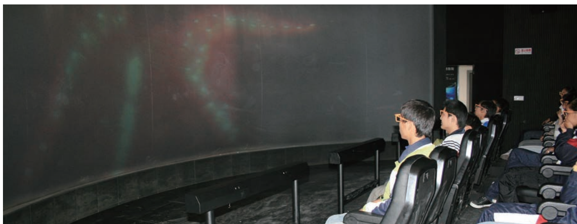
同学们在观看3D 科普电影