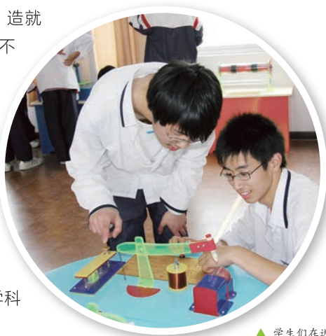
▲ 学生们在进行科普实验

新思路，以学生发展为本，努力提高青少年的科学素质，造就新世纪的创新人才，不断探索科学可行的模式和方法，要把开发青少年的潜能作为重点，引导学生开展多层次的科技活动，培养学生创新意识、创新能力，使滕头学生社会实践基地真正成为学生爱科学、学科学、用科学的乐园。