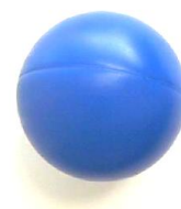
图 3 乐高球