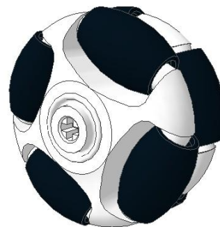
图 4 万向轮