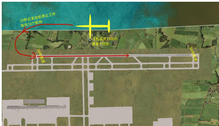
(图中飞机位置仅供参考，以配置文件中飞机位置为准)